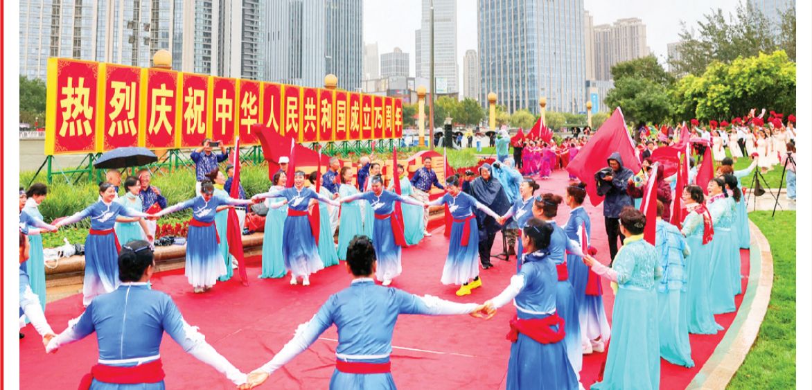
昨日,河北区举行主题活动,庆祝祖国生日,在庄严的升国旗仪式后,各界群众载歌载舞。

此外,我市还在海河沿线、迎宾路线、世纪钟、古文化街等重点区域,通过夜景灯光配置营造氛围,展示城市的热度与活力。桥体、水系、风貌建筑、商业招牌及户外广告的灯光设计,贯通全城,形成点、线、团、片相结合的灯光景观,烘托出节日的喜庆氛围。