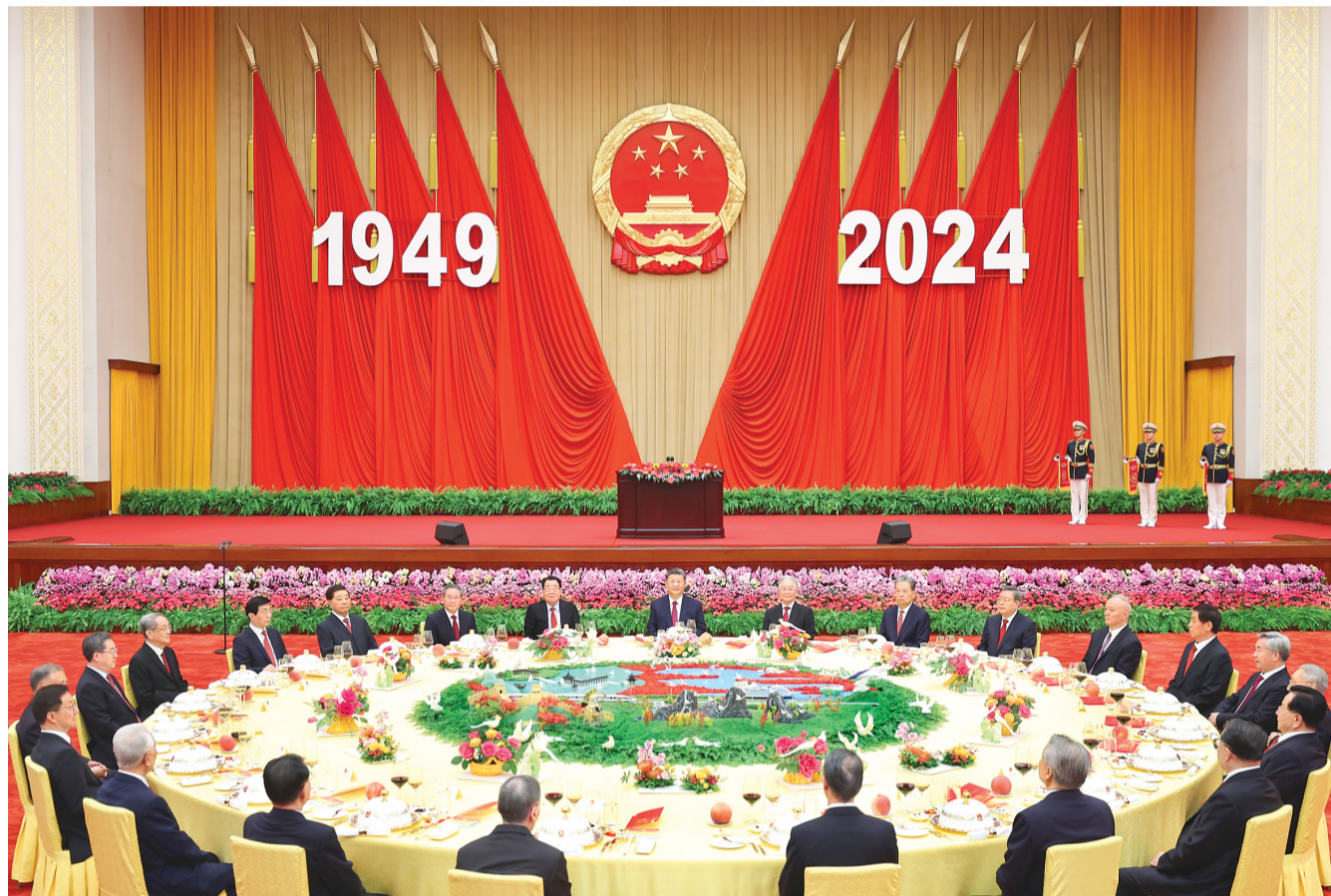
9月30日晚,庆祝中华人民共和国成立75周年招待会在北京人民大会堂隆重举行。中共中央总书记、国家主席、中央军委主席习近平出席招待会并发表重要讲话。