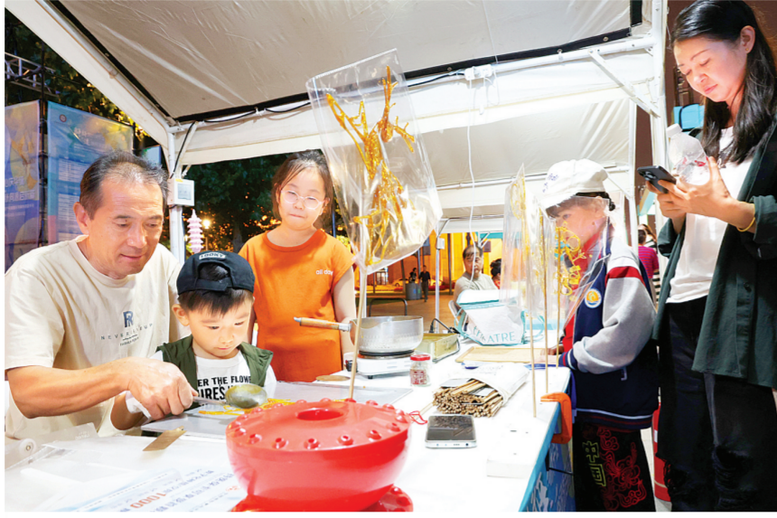
昨天,京津冀非遗市集在天津文化中心拉开帷幕,众多特色非遗项目亮相。

作为此次活动的重头戏之一,2024京津冀非物质文化遗产联展将二十四节气与京津冀的国家级和省市级非遗近百个项目、300余件展品融合在一起,通过古诗和农谚反映人们的生活方式,展现“见人见物见生活”的文化传承。在“春华—万物生长”板块,于非创作的《牡丹图》与杨柳青木版年画《仕女春春》《长命百岁》、武强木