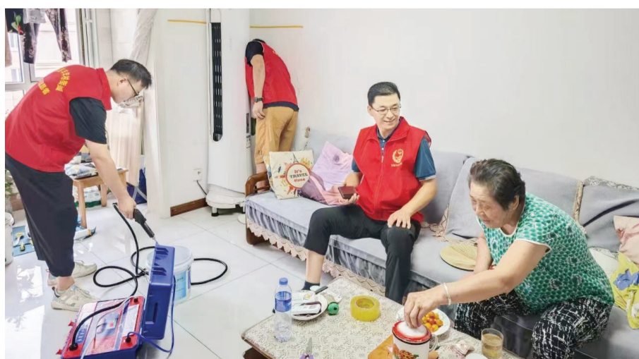
志愿服务队队员在居民家中进行志愿服务。

从法律援助到政策咨询,从家电维修到义务理发……志愿服务队队员凭借各自的专业技能,为居民提供了全方位、多样化的志愿服务,实现了居民与居民、居民与辖区单位、居民与商户之间的“邻里互助、资源互通、便捷共享”的新模式,不仅满足了居民的实际需求,更成为了社区连接居民情感的纽带。