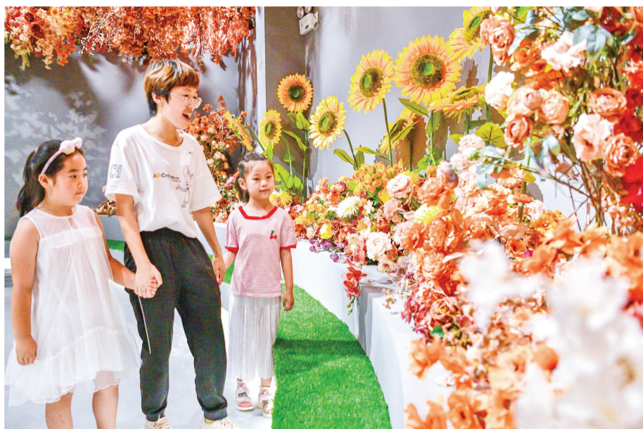
▲曹子里镇打造绢花产业文化园,赋能绢花产业规模化、集群化发展,助推传统产业转型升级。

来到位于崔黄口镇的天津安芝金地毯有限公司(以下简称“安芝金地毯”)生产车间,伴随着机器的轰鸣声,一张张图案精美、品质优良的地毯“走”下生产线。工人们全力投入到紧张