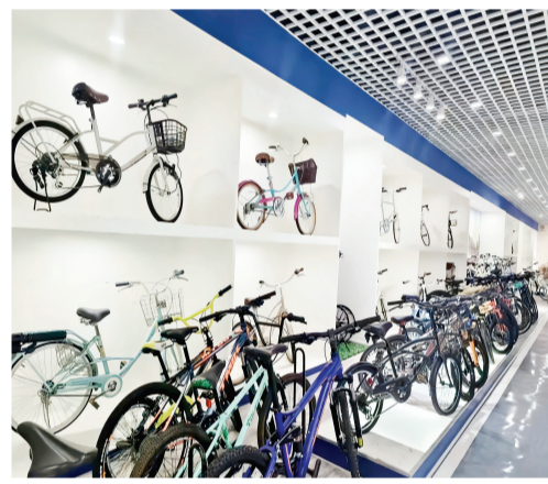
▲位于王庆坨镇的天津市利雅得工贸有限公司展厅内,该公司生产的系列自行车产品一一亮相。