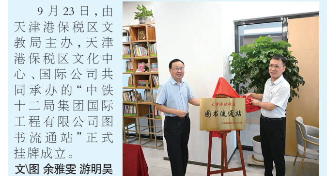
9月23日,由天津港保税区文教局主办,天津港保税区文化中心、国际公共共同承办的“中铁十二局集团国际工程有限公司图书流通站”正式挂牌成立。文图 余雅雯 游明昊

本次赛事由市体育局、市农业农村委、市文化和旅游局、西青区委区政府联合主办,设有半程马拉松、5公里欢乐跑及5公里职工健康跑三个项目。赛事沿用并优化上届线路,途经国家粮棉中心、中化MAP现代农业示范区、丰收塔、万亩稻田等。