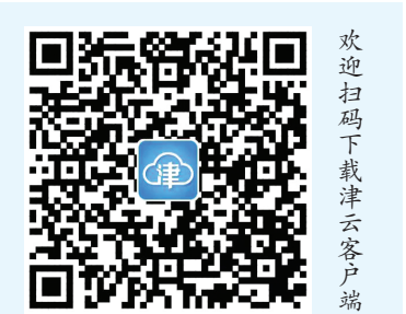
欢迎扫码下载津云客户端

值得一提的是,在现场,由中国电子技术标准化研究院、天津爱波瑞科技发展有限公司、天津财经大学、中国企业改革与发展研究会企业管理研究分会联合编写的《2024中国制造业精益数字化发展报告》正式发布。参会代表纷纷表示,发展新质生产力是助推企业高质量发展的内在要求和着力点,中国企业要从过去的单打独斗,向供应链之间的协同、产业链上下游生态的构建迈进,推动精益数字化赋能新质生产力发展。