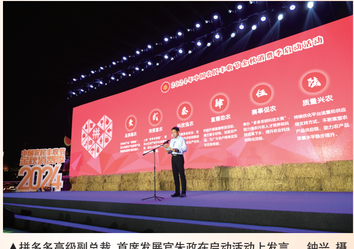
▲拼多多高级副总裁、首席发展官朱政在启动活动上发言。

9月7日,由农业农村部、商务部等部门联合发起的“2024年中国农民丰收节金秋消费季”活动在天津正式启动。作为电商平台,拼多多联合中国农业电影电视中心,通过现场直播间向广大消费者推介甘肃渭源等7个帮扶县的特色农货,推动当地农货出村进城。