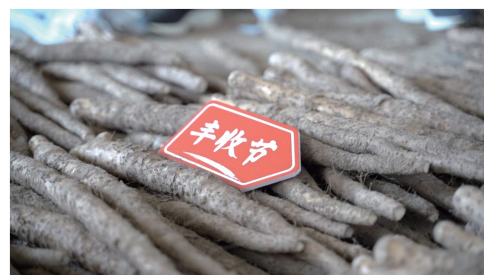
▲马为民仓库中已分拣的铁棍山药。

在河南焦作市温县,拼多多商家马为民种植的铁棍山药迎来收获的季节,与去年相比,今年马为民种植的铁棍山药产量增长40%,也带动当地更多的农户加入种植、采挖、分拣山药的产业链中。