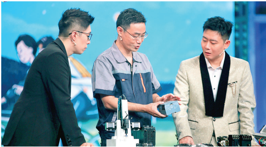
《非你莫属》现场截图

本报讯(记者 张帆)教师节将至,天津卫视《非你莫属》节目在9月8日、9日推出青春季特别企划“桃李报师恩”,以教育家精神为引领,共兴尊师风尚。