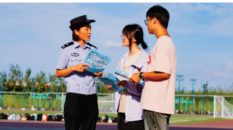
在活动主会场天津大学(北洋校区),民警向师生传授反诈防骗知识。