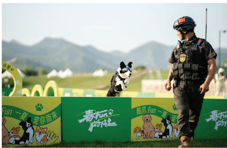
犬只在驯犬师指导下练习穿越障碍。

今年6月,春山里联合相关企业以“生态——变革——扎根泥土的力量”为主题举办中国绿色艺术论坛及展览,邀请各界知名专家从艺术、建筑设计、绿色低碳产业等多个角度讲述艺术与生态的紧密联系以及绿色低碳产业的发展趋势,并展出由混凝土等环保材料加工而