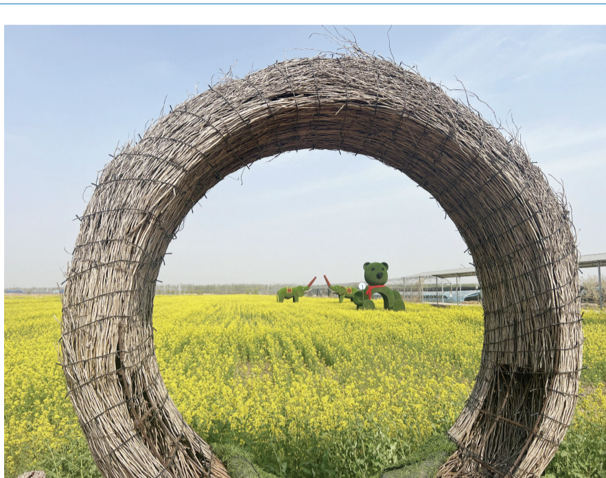
春光家庭农场美景。