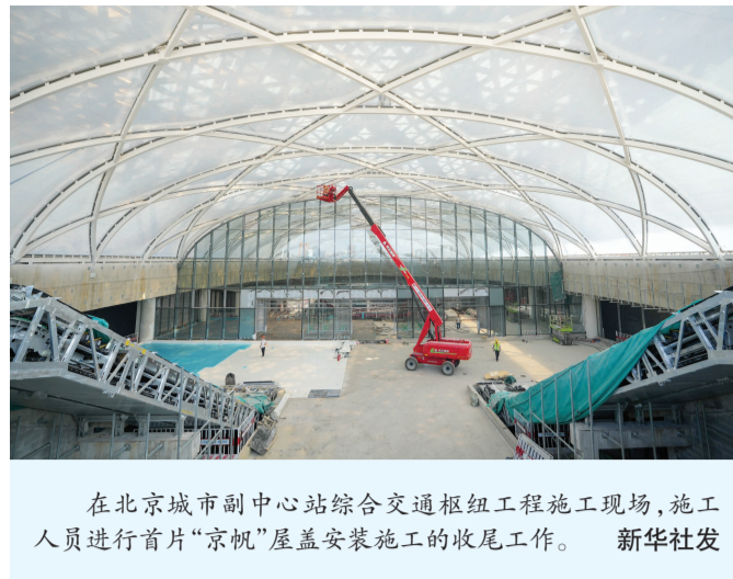
在北京城市副中心站综合交通枢纽工程施工现场，施工人员进行首片“京帆”屋盖安装施工的收尾工作。