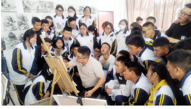
“行走的美术馆”小分队开展公益美术课堂系列活动。

在昌都市第二初级中学，“行走的美术馆”小分队带来国家级非遗项目天津风筝魏制作技艺课。小分队为学生们讲述了天