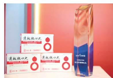
“2024健康产业品牌榜”围绕产品价值、市场价值、盈利预期和用户赞誉四个维度,运用系统、科学的4D-BES体系对品牌进行立体扫描和评估,通过全数据量化的指数方式,建立品牌发展指数评价模型,并根据指数评价结果进行评选,反映品牌的综合竞争力,是中康科技参考中企评医药健康专委会发布的“2024中国健康产业品牌发展指数”、行业监管数据库、公开投票数据和

8月12日,“增量突破·解码品类”——2024健康产业品牌榜颁奖盛典在西普会隆重举行。西普会已连续七年重磅发布中国健康产业年度榜单,被业界誉为“产业奥斯卡”,旨在发掘具有行业影响力和成长潜力的优秀企业及品牌,树立行业先进标杆模范。