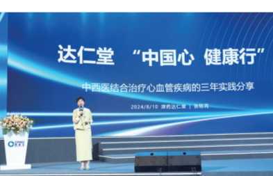
达仁堂“中国心·健康行” 中西医结合治疗心血管疾病的三年实践分享

8月9日,第十七届中国健康产业(国际)生态大会(简称“西普会”)在海南博鳌盛大启幕。本届大会以“承压前行——从存量走向增量的破与立”为主题,聚焦产业的转型升级之需,紧密围绕生命科学的前沿动态与未来趋势展开探讨,为健康产业投资及研发辨析方向。