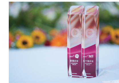
“2024健康产业品牌榜”围绕产品价值、市场价值、盈利预期和用户赞誉四个维度,运用系统、科学的4D-BES体系对品牌进行立体扫描和评估,通过全数据量化的指数方式,建立品牌发展指数评价模型,并根据指数评价结果进行评选,反映品牌的综合竞争力,是中康科技参考中企评医药健康专委会发布的“2024中国健康产业品牌发展指数”、行业监管数据库、公开投票数据和

同期,中康产业研究院也发布了备受瞩目的“2024医药工业综合竞争力百强榜”、“2024中成药工业综合竞争力50强”。天津医药集团凭借行业影响力以及品牌实力等多方面的综合优势脱颖而出,荣登双榜。其中,天津医药集团在“2024医药工业综合竞争力百强榜”排名较2023年提升32位。