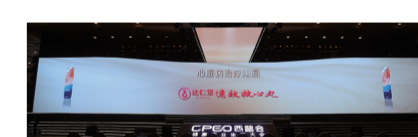
中康科技行业数据库和调研结果,通过科学量化评价,评选产生的综合性榜单。

未来,企业将继续深耕心血管疾病预防治疗领域,不断探索创新,为患者提供安全有效、质量可控的好药,期待速效救心丸在助力优化胸痛救治流程、加强救治能力、提升救治效果方面发挥更大的作用,推动中医药传承发展迈向“心”高度,为守护亿万家庭心脏健康贡献津药力量。