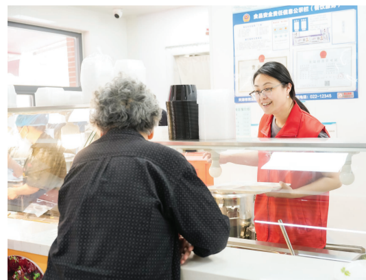
▶靖江里外社区食堂内。