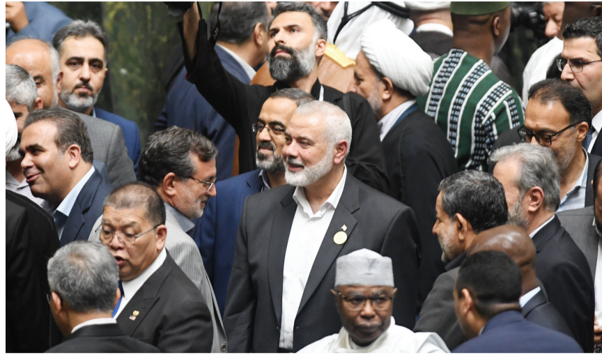
这是7月30日在伊朗德黑兰拍摄的伊斯梅尔·哈尼亚(中)。

土耳其外交部谴责在德黑兰发生的“卑鄙行径”,认为这次暗杀行为目的在于将加沙战争扩大化。除非国际社会采取行动阻止以色列,否则该地区将面临更大的冲突。约旦外交部也发表声明强烈谴责暗杀事件,表示这一行为将导致地区局