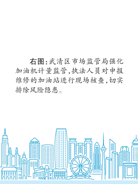
右图:武清区市场监管局强化加油机计量监管,执法人员对申报维修的加油站进行现场核查,切实排除风险隐患。