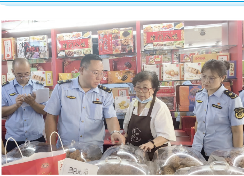
左图:和平区市场监管局开展麻花经营主体专项检查,重点检查主体证照、进货查验制度是否落实到位、预包装及散装麻花标签信息是否完整。

近年来,天津市场监管部门高度重视民主党派对口联系和联谊交友工作,联合民革、农工党、九三学社等民主党派多次开展实地调研、座谈交流、主题教育、建言献策等活动,注重发挥党外人士在科技、教育、文化等方面的界别优势,提升建言资政质效。下一步,将坚持用新时代党的统一战线工作的重要思想凝心铸魂,紧扣我市“十项行动”和市场监管“五大工程”,拓宽知情明政渠道,构建市场监管大统战工作格局,彰显市场监管统战担当。