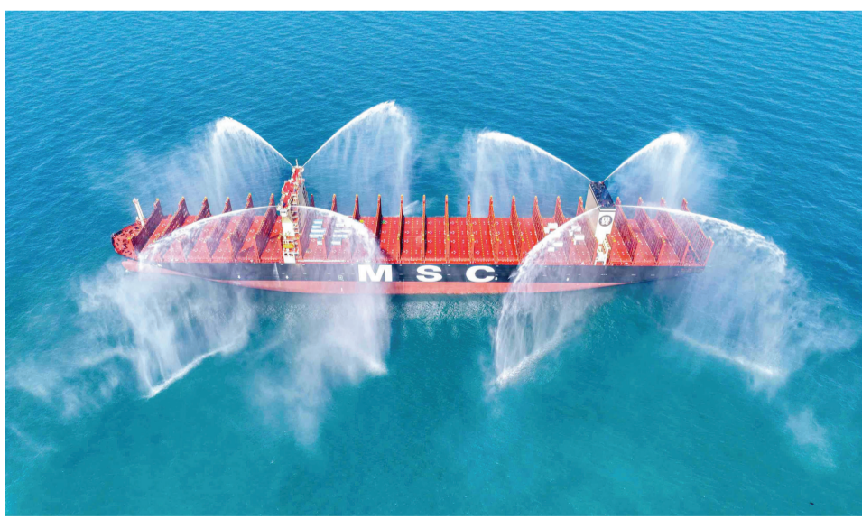
中船天津建造的第三艘集装箱船“地中海莱拉”轮。

据了解,今年以来,中船天津大坞、小坞两条总装生产线捷报频传,承建的16000标准箱集装箱船5号船提前合同期67天交付,16000标准箱集装箱船7号船提前合同期140天交付,8.5万吨散货船3号船提前合同期135天交付。中船天津完成了10余项建模推进计划、40余项工艺推进项目,涉及工序前移、工艺优化、自动焊推广、专业化生产、新工装应用等多方面。此外,还顺利完成国内首次B型舱双车联吊作业,填补了国内又一项技术空白,对比海吊、云轨车配合施工模式,单船可节省费用近千万。 中船天津通过设立“三大中心”,着力化解在技术创新、高效保障、成本管控等方面的难点问题;持续完善生产准备计划管控体系,深化成本工程,创新管理模式,全面开展成