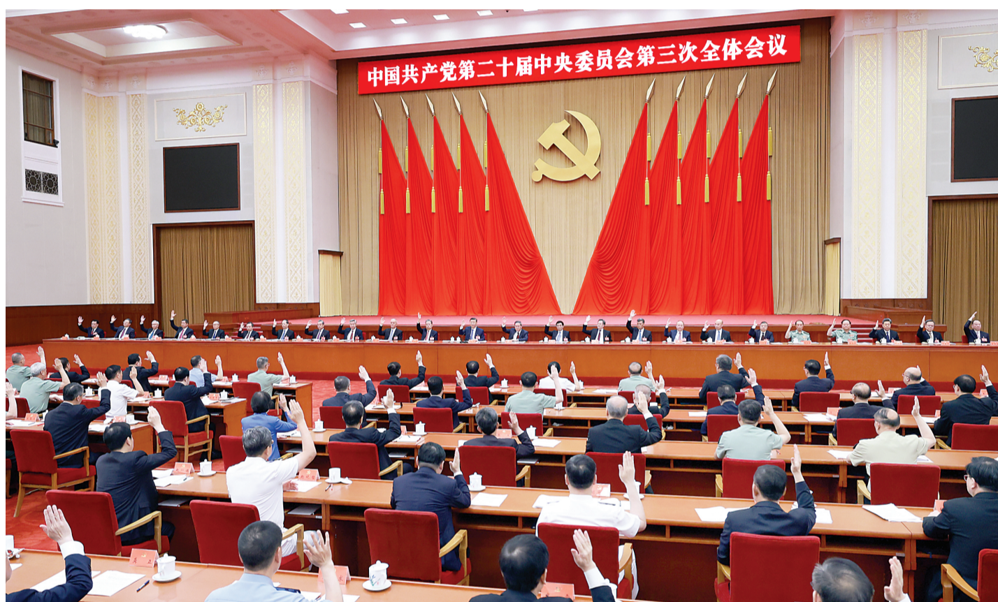
中国共产党第二十届中央委员会第三次全体会议,于2024年7月15日至18日在北京举行。中央委员会总书记习近平作重要讲话。