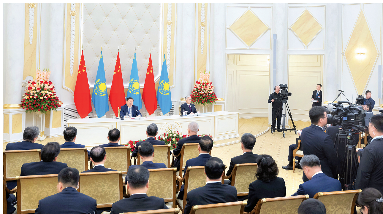
当地时间7月3日中午,国家主席习近平在阿斯塔纳总统府同哈萨克斯坦总统托卡耶夫会谈后共同会见记者。