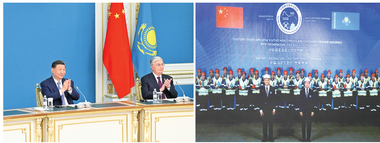
当地时间7月3日中午,国家主席习近平同哈萨克斯坦总统托卡耶夫在阿斯塔纳总统府以视频方式共同出席中欧跨里海直达快运开通仪式(拼版照片)。

新华社阿斯塔纳7月3日电(记者 郝薇薇 安晓萌)当地时间7月3日中午,国家主席习近平同哈萨克斯坦总统托卡耶夫在阿斯塔纳总统府以视频方式共同出席中欧跨里海直达快运开通仪式。