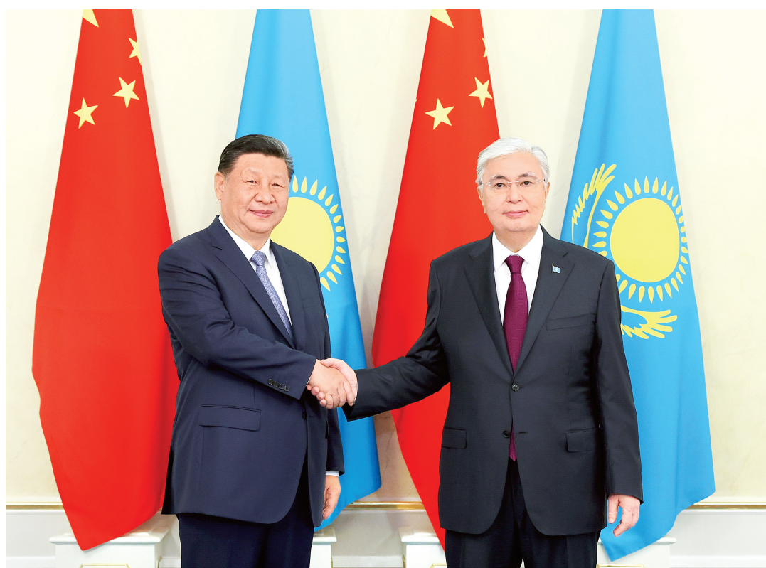
当地时间7月3日上午,国家主席习近平在阿斯塔纳总统府同哈萨克斯坦总统托卡耶夫举行会谈。这是习近平同托卡耶夫握手。

新华社阿斯塔纳7月3日电(记者 倪四义 胡晓光 张继业)当地时间7月3日上午,国家主席习近平在阿斯塔纳总统府同哈萨克斯坦总统托卡耶夫举行会谈。