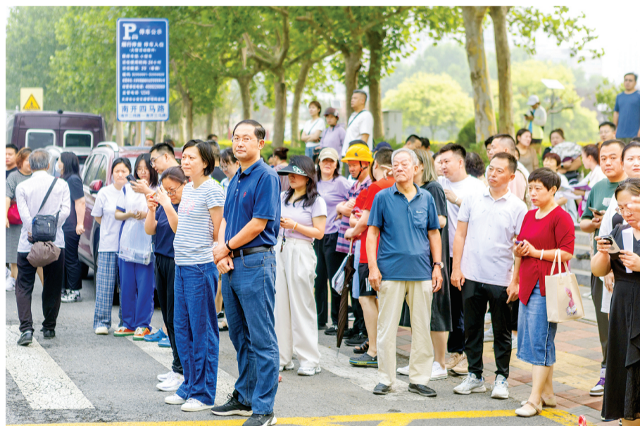
2024年中考平稳进行。在南开中学考点外,一些家长在等候。

问题的卓越工程师;今年南开大学计划招生4120人,新增数据科学、考古学2个专业,通过录取时志愿填满不重复保证100%进入志愿(体检合格)不调剂和大类分流时100%按照学生意愿进入人类任何专业,以及“放开选”“放开修”“放开转”“放开保”政策,为学子成长创造无限可能。