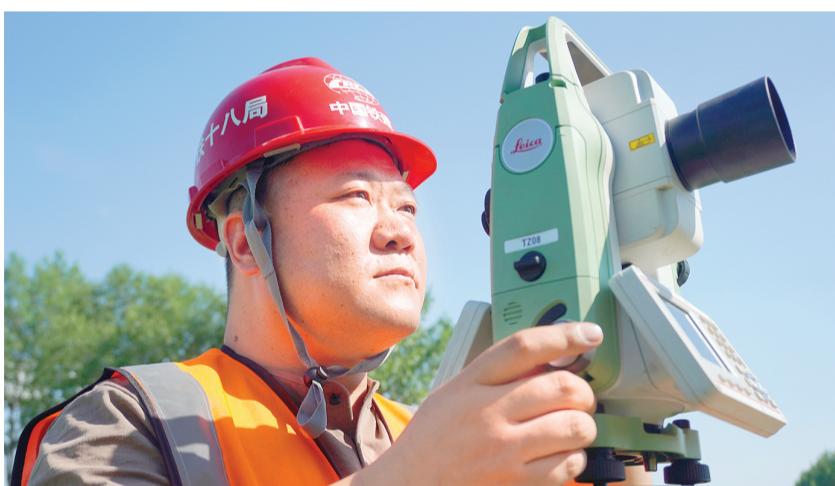
昨天,中铁十八局勘察设计院工程师们来到空港经济区“口袋公园”现场,进行实地勘测,加快推进项目建设。图为烈日下测绘人员现场开展全站仪测设工作。

天津南1000千伏变电站主变扩建工程是国家“十四五”电力发展规划重点项目,投运后,天津地区特高压电能承载、输送能力可提升至原先的两倍,天津电网将形成“三通道两落点”特高压受电格局,京津冀地区将建成特高压双环网,对推动构建新型电力系统,打造能源革命先锋城市,实现“双碳”目标具有重要作用。