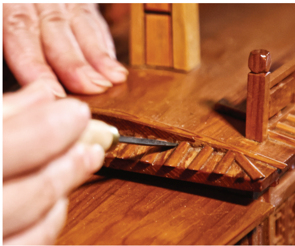
精雕船模屋顶瓦楞。