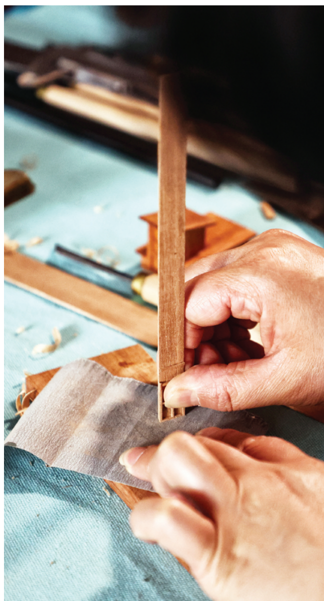
对每一个零部件进行打磨抛光。