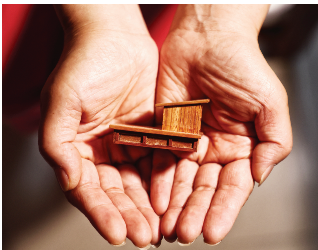
制作的花梨木零部件小巧精致。