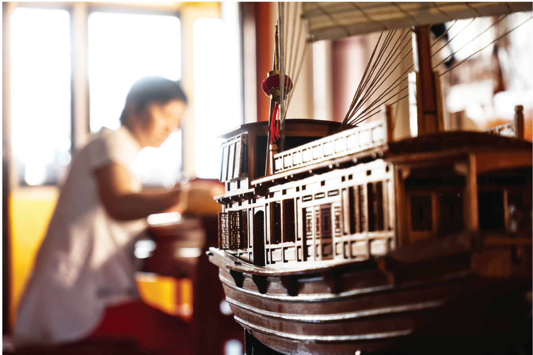
每一艘船模都要经历成百上千道工序。