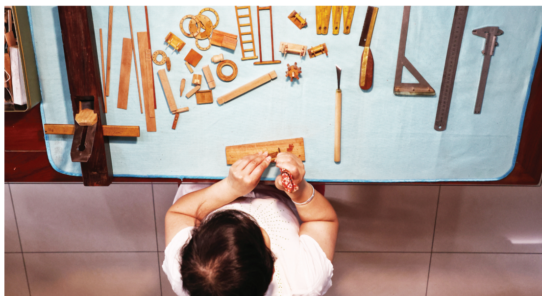
传统手工艺制作，工序繁杂但每一道都需要十分精准。