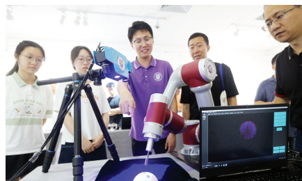
图为展出的智能化生产线自动识别打磨机器人。

器人、智能表情机器人等多种机器人轮番登场,便携式口腔检查牙科椅箱组创新设计、纺织科技与功能性服装开发等一个个