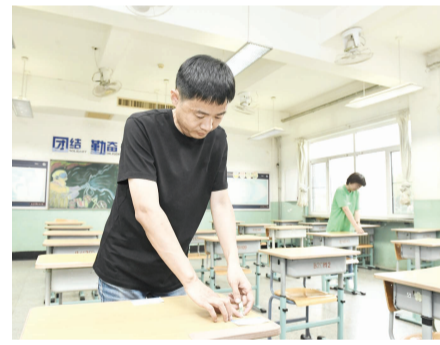
今年高考6月7日开始,位于东丽区的天津市第一百中学考点已准备就绪,即将迎接考生。