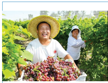
胡张庄葡萄喜获丰收(资料图)

说起东丽区基层治理的难题,老村台算是其中之一,全区尚存的56个老村台里居住着2.7万人,且大多为外来人口。长期以来,老村台基础设施配套不全,环境脏乱,存在较高的安全风险隐患。对此,东丽区把老村台的人居环