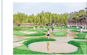
赤土空间森林亲子部落