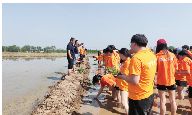
天津现代职业技术学院学生走进津南区北闸口镇正营村体验插秧。

传承和弘扬农耕文化,展现现代农业技术与成果,不久前,正营村还举办了“第三届插秧节”,为天津机电学院机械学院相关领导颁发了“乡村振兴”指导员聘请证书,双方将立足各自资源优势和工作特色,以党建引领为纽带,推动村校共建各项工作再上新台阶。同时,多个企业及个人进行了稻田认养,共同参与稻田管理与