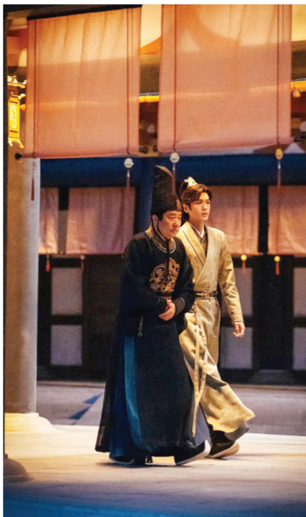
《庆余年第二季》剧照

在待播古装剧中,《大奉打更人》根据卖报小哥君创作的同名网络小说改编,讲述了许七安屡破奇案,卷入朝堂危机的故事。根据桐华同名小说改编的《长相思2》将延续第一部的剧情,上演关于亲情、爱情、友情的纠葛故事。《藏海传》则讲述了大雍国钦天监监正刚毅之子稚奴,背负家仇的他10年后化名藏海重回京城,凭借多年学习的营造技艺和纵横之术,一路智斗奸佞的故事。