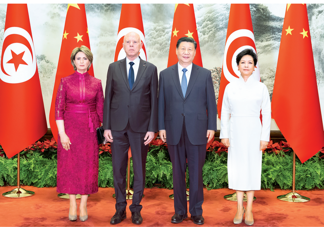
5月31日上午，国家主席习近平在北京人民大会堂同来华国事访问并出席中国—阿拉伯国家合作论坛第十届部长级会议开幕式的突尼斯总统赛义德举行会谈。这是会谈前，习近平和夫人彭丽媛同赛义德和夫人伊什拉芙合影。