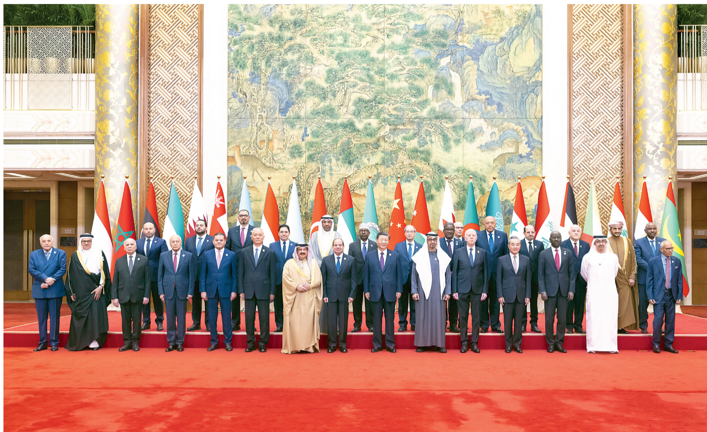
5月30日上午,国家主席习近平在北京钓鱼台国宾馆出席中阿合作论坛第十届部长级会议开幕式并发表主旨讲话。这是习近平同巴林国王哈马德、埃及总统塞西、突尼斯总统赛义德、阿盟秘书长盖特以及22位阿拉伯国家代表团团长集体合影。

一是更富活力的创新驱动格局。中方将同阿方在生命健康、人工智能、绿色低碳、现代农业、空间信息等领域共建10家联合实验室;加强人工智能领域合作,共同促进人工智能赋能实体经济,推动形成具有广泛共识的全球人工智能治理体