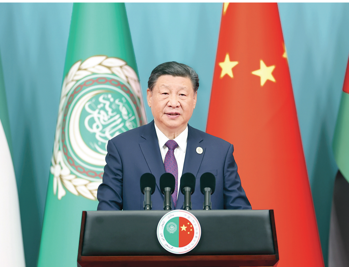
5月30日上午,国家主席习近平在北京钓鱼台国宾馆出席中阿合作论坛第十届部长级会议开幕式并发表主旨讲话。