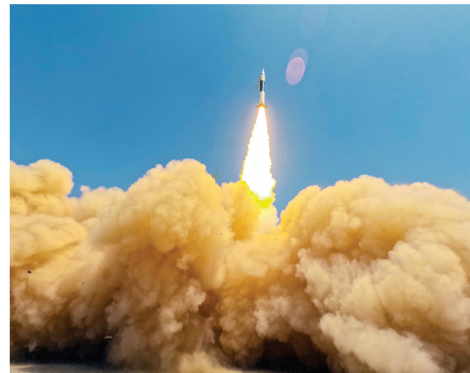
5月21日12时15分,我国在酒泉卫星发射中心使用快舟十一号遥四运载火箭,成功将武汉一号卫星、超低轨技术试验卫星发射升空,卫星顺利进入预定轨道,发射任务获得圆满成功。这次任务还搭载发射了天雁22星、灵鹊三号01星。

中期目标,直面金融领域存在的风险隐患,按照防风险、强监管、促发展的工作主线,讲求策略方法,坚持实事求是、因地制宜,扎实做好金融领域重点工作。当前,要统筹做好房地产风险、地方政府债务风险、地方中小金融机构风险等相互交织风险的严防严控,严厉打击非法金融活动。要全面加强地方金融组织监管,协同强化中小金融机构监管。要找准金融支持实体经济切入点着力点,加大对重大战略、重点领域和薄弱环节的支持,着力促进经济社会高质量发展,并在这一过程中实现金融自身高质量发展。要切实加强地方党委金融办自身建设,全面完成机构改革任务,把加强党对金融工作的领导落到实处,积极打造模范机关,大力弘扬中国特色金融文化,狠抓工作落实,高效履行职责。