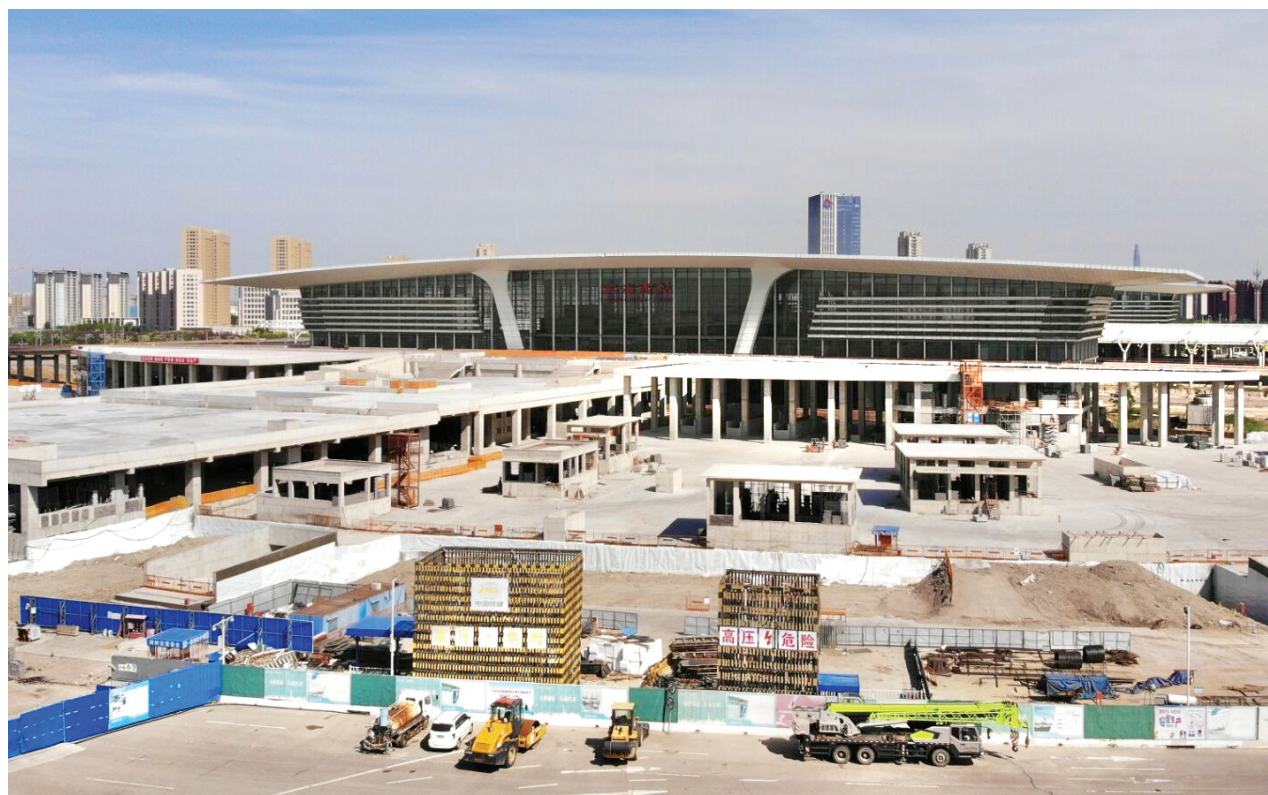
近日,由中铁十八局参建的滨海西站市政配套工程土建工程完成全部二次结构施工,为主体结构完工奠定基础。滨海西站市政配套工程是京津冀协同发展重大市政基础设施建设项目,是滨海新区唯一集多种交通方式于一体的大型地上综合交通枢纽。