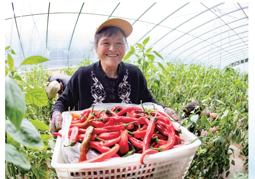
津甘共建农业产业园喜获丰收,当地农民笑逐颜开。

津甘两地党委政府高度重视东西部协作,将其纳入天津“十项行动”和甘肃“三抓三促”重要内容,攻坚克难、持续用力,推动协议项目落地实施和合作事项取得实效;各结对区县紧紧围绕“巩固拓展脱贫攻坚成果、全面推进乡村振兴”主线,聚焦助力增强脱贫地区和脱贫群众内生发展动力,携手推动协作支援工作迈上新台阶。“津洽会”“兰洽会”举办期间,省