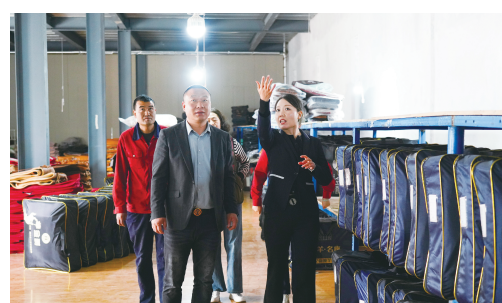
天津援甘专技人才了解当地企业生产情况。