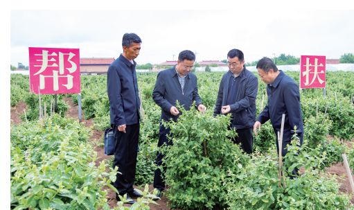
天津援甘干部了解当地金银花种植情况。

在天津优势资源的加持下,天津开展技能大师双向交流、加强高技能人才培养,推动“津甘技工”等劳务品牌得到新提升;做优做强“宁远建筑工”“鸳鸯玉雕师”“镇原护工”等劳务品牌,策划“环县养羊人”特色技能培训,2023年援建、提升改造729个就业帮扶车间,带动2.42万名群众增收。此外,天津策划“雨