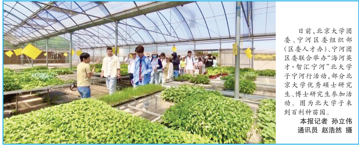
日前,北京大学团委、宁河区组织部(区委人才办)、宁河区区委联合举办“海河英才·智汇宁河”北京大学宁河行活动,部分北京大学优秀硕士研究生、博士研究生参加活动。图为北京大学学子来到百利种苗园。 本报记者 孙立伟 通讯员 赵浩然 摄

企业与投资方对接,有力助推科技成果转化,促进科技和产业深度融合。渤海证券天开园综合金融服务平台正是金融机构加快推进高质量金融服务供给的一个良好示范,将为发展新质生产力持续注入强大动能。下一步,渤海证券天开园综合金融服务平台将致力于发挥好“服务平台”和“桥梁纽带”两大关键作用,“服务平台”作为渤海证券各业务条线服务天开园的平台和基地,“桥梁纽带”成为链接天开园内外各方资源的桥梁和纽带,以“专业化、特色化、差异化”经营为指导,主动收集园区企业要素信息、分析要素特征,以高质量金融服务提升要素配置效率,强化产融资源对接,畅通“科技—产业—金融”的良性循环,努力成为天津科技创新、产业焕新和经济高质量发展贡献“渤海智慧”和“渤海力量”。 通讯员 戴云岭