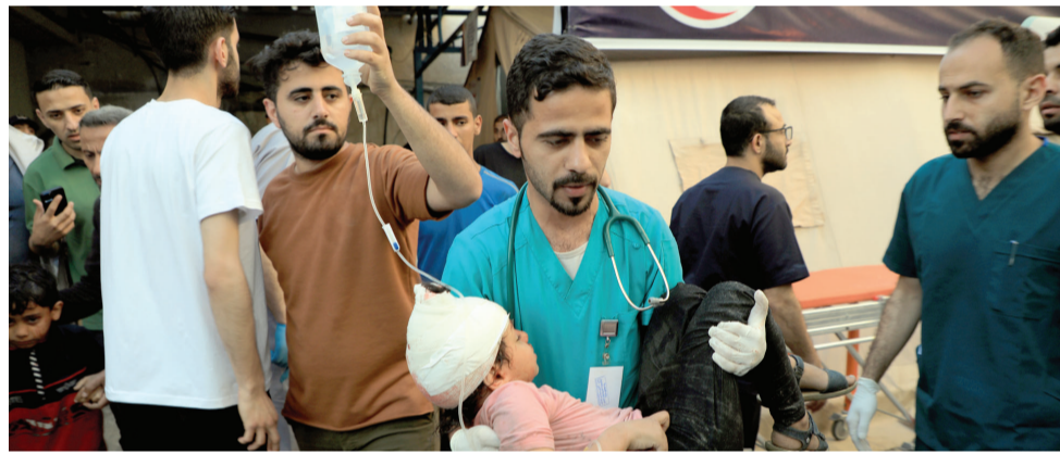
5月8日,医护人员在加沙地带南部城市拉法一处医院转移受伤的儿童。以军自7日凌晨起密集轰炸加沙地带最南端城市拉法,目前已造成至少35人死亡。

拉法口岸已遭封锁 连续三天“无任何物资和人员获准进出加沙” 停火谈判破裂 以色列扩大在拉法军事行动