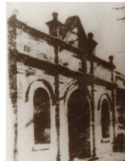
河北省第三监狱旧址

以上内容由红桥区委党史研究室摘自《天津市红色资源概览》,上述旧址入选《天津市红色资源名录(第一批)》。