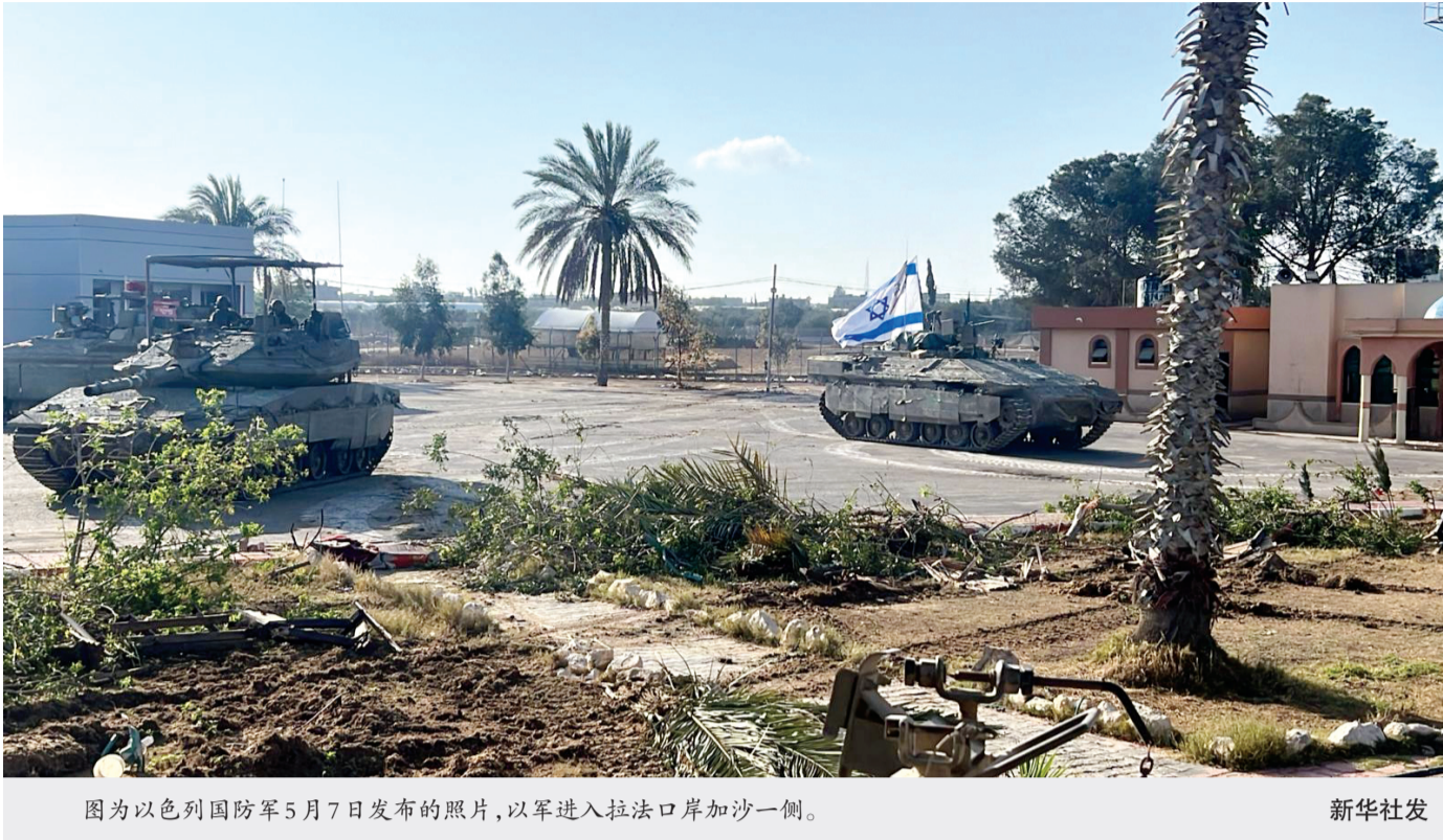
图为以色列国防军5月7日发布的照片,以军进入拉法口岸加沙一侧。