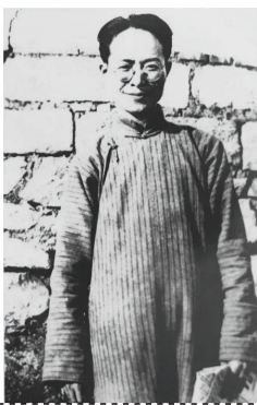
1938年,写作《长河》时期的沈从文。