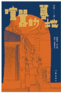
《喧嚣的墓地》,李骏著,作家出版社2023年11月出版。

近代中国面对世界格局的变化和西方文化的涌入,自给自足的社会形态遭到前所未有的冲击和挑战。面对国难当