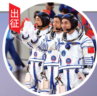
出征 叶光富、李聪、李广苏3名航天员领命出征。

舱外载荷和舱外平台设备安装与回收等各项任务。这次任务是我国载人航天工程进入空间站应用与发展阶段的第3次载人飞行任务,是工程立项实施以来的第32次发射任务,也是长征系列运载火箭的第518次飞行。 目前,空间站组合体已进入对接轨道,工作状态良好,满足与神舟十八号载人飞船交会对接和航天员进驻条件。