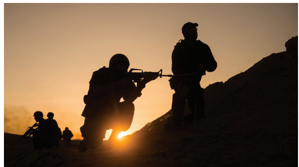
以色列国防军4月24日发布的照片显示,准备在加沙开展军事行动的以军预备役士兵在以色列一处地点训练。

路透社引述那名以方高级防务官员的说法报道,以色列国防部已经购置4万顶帐篷,每个帐篷能容纳10至12