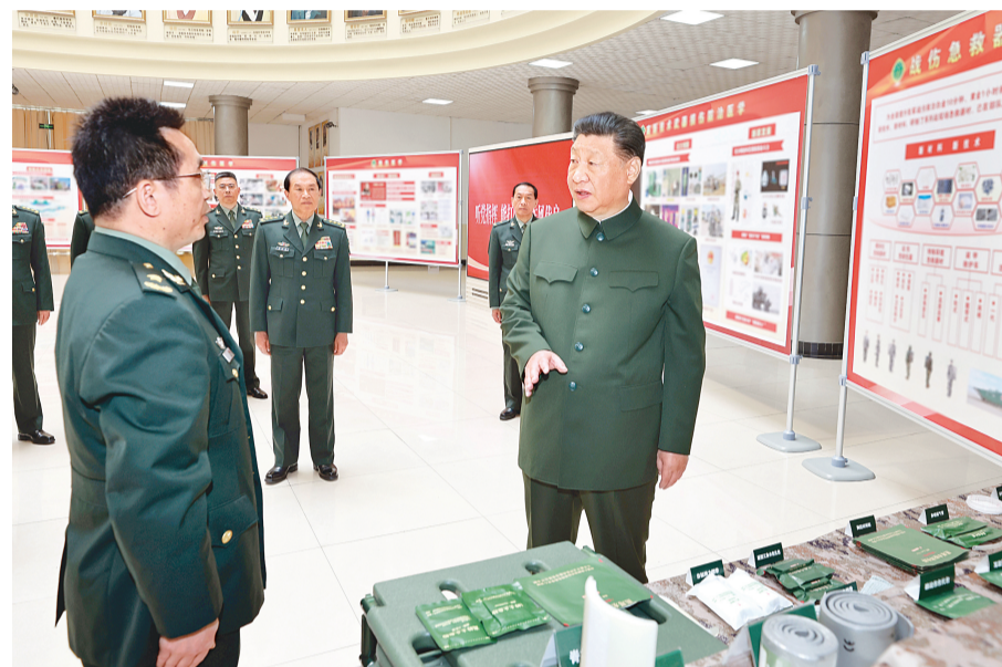
4月23日,中共中央总书记、国家主席、中央军委主席习近平到陆军军医大学视察。这是习近平察看战伤急救器材和学员操作演示。