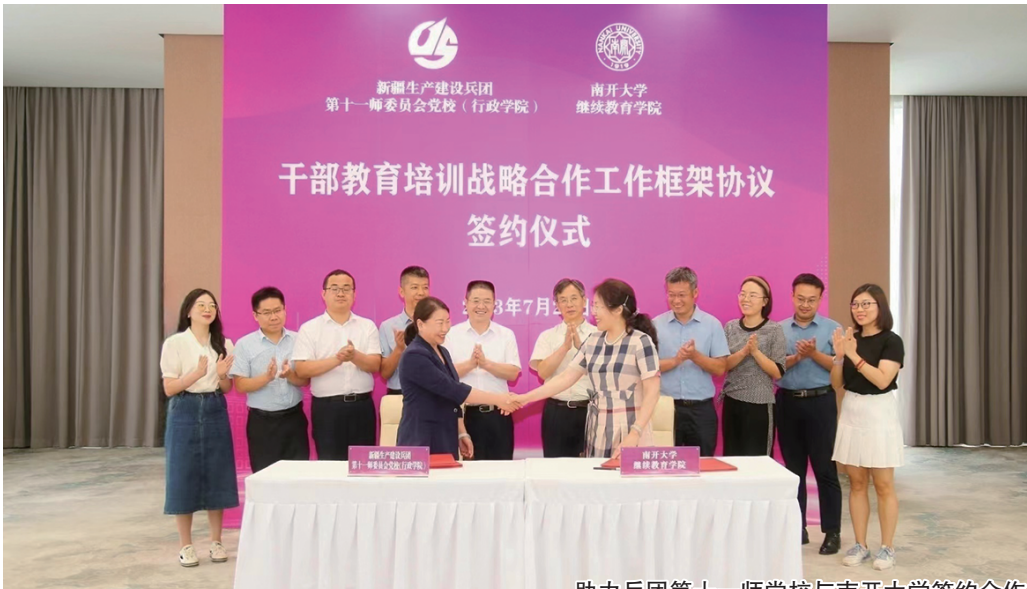
助力兵团第十一师师校与南开大学签约合作