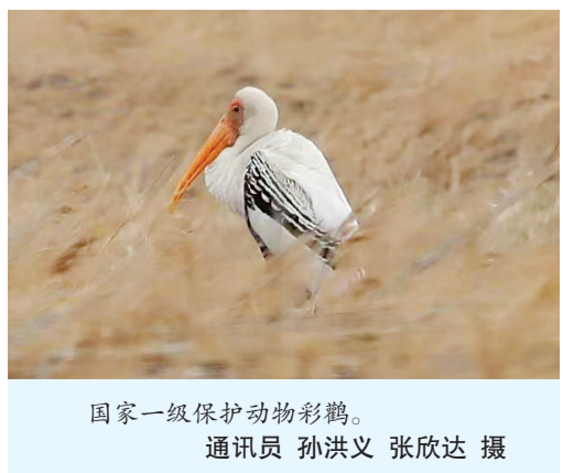
国家一级保护动物彩鹳。

据统计,截至目前,今春过境我市候鸟总数已超过80万只,包含大量国家一、二级保护鸟类,候鸟种类和数量相比去年同期均有所增加。除东方白鹳、大天鹅、小天鹅、灰鹤等“常客”,国家一级保护动物彩鹳首次现身我市。彩鹳在国内的分布记录极为有限,此次现身不仅体现了我市生态环境保护与修复工作对维护生物多样性起到的显著成效,也凸显了我市作为国际候鸟重要迁徙通道,对候鸟迁徙发挥的重要作用。(下转第2版)