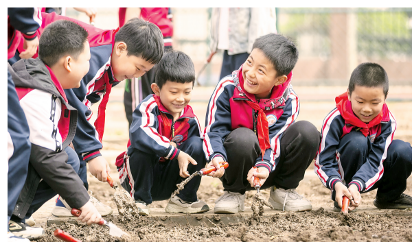
津城校园“农场”悄悄“上新”。青椒、土豆、向日葵、小白菜……各类种子播撒在校园的“田间地头”。图为红桥区三中小附小的学生正在校园劳动苗圃里播种。