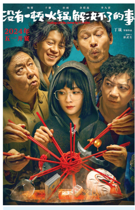
《没有一顿火锅解决不了的事》海报

表示:“新片上映需要有吸引观众的宣传点,无论是明星的热度还是作品获得的奖项,‘借势’已经成为目前市场营销的重要手段,能够进一步挖掘作品的市场潜力。”