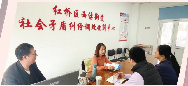
红桥区纪委监委驻区委办纪检监察组实地走访西沽街道社会矛盾纠纷调处化解中心。