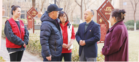
河北区纪委监委第二监督检查室联合铁东路街道纪检监察工委,深入北宁湾社区调研“好人社区”建设情况。