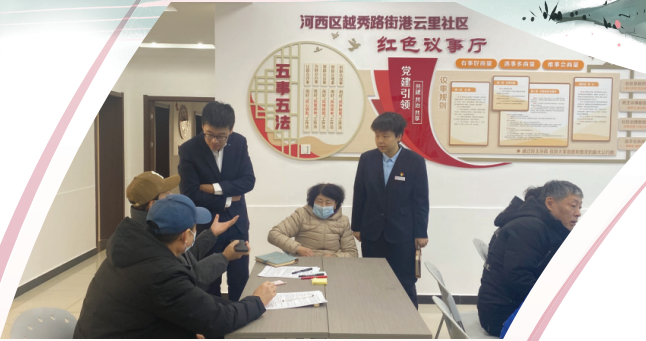
河西区港云里社区“红色议事厅”议事协调会正在进行热烈讨论。