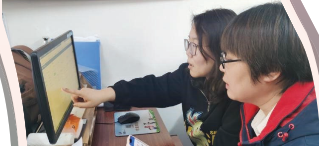
南开区万兴街道纪检监察工委与社区纪检监察工作联络站工作人员查看问题办理情况。