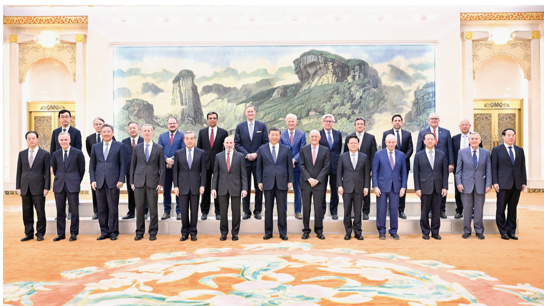
3月27日,国家主席习近平在北京人民大会堂集体会见美国工商界和战略学术界代表。