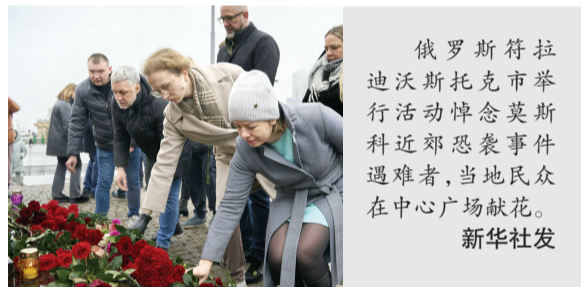
俄罗斯符拉迪沃斯托克市举行活动悼念莫斯科近郊恐袭事件遇难者,当地民众在中心广场献花。新华社发

3月23日,俄罗斯首都莫斯科街头的广告牌播出蜡烛图案,悼念莫斯科近郊恐袭事件遇难者。新华社发