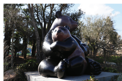
3月22日在法国中部城市圣艾尼昂的博瓦勒野生动物园拍摄的大熊猫雕塑。

据新华社法国圣艾尼昂3月22日电 以首只在法国诞生的大熊猫“圆梦”为原型的大型铜雕22日在法国博瓦勒野生动物园揭幕。这家法国知名动物园又多了一处“打卡”景点。