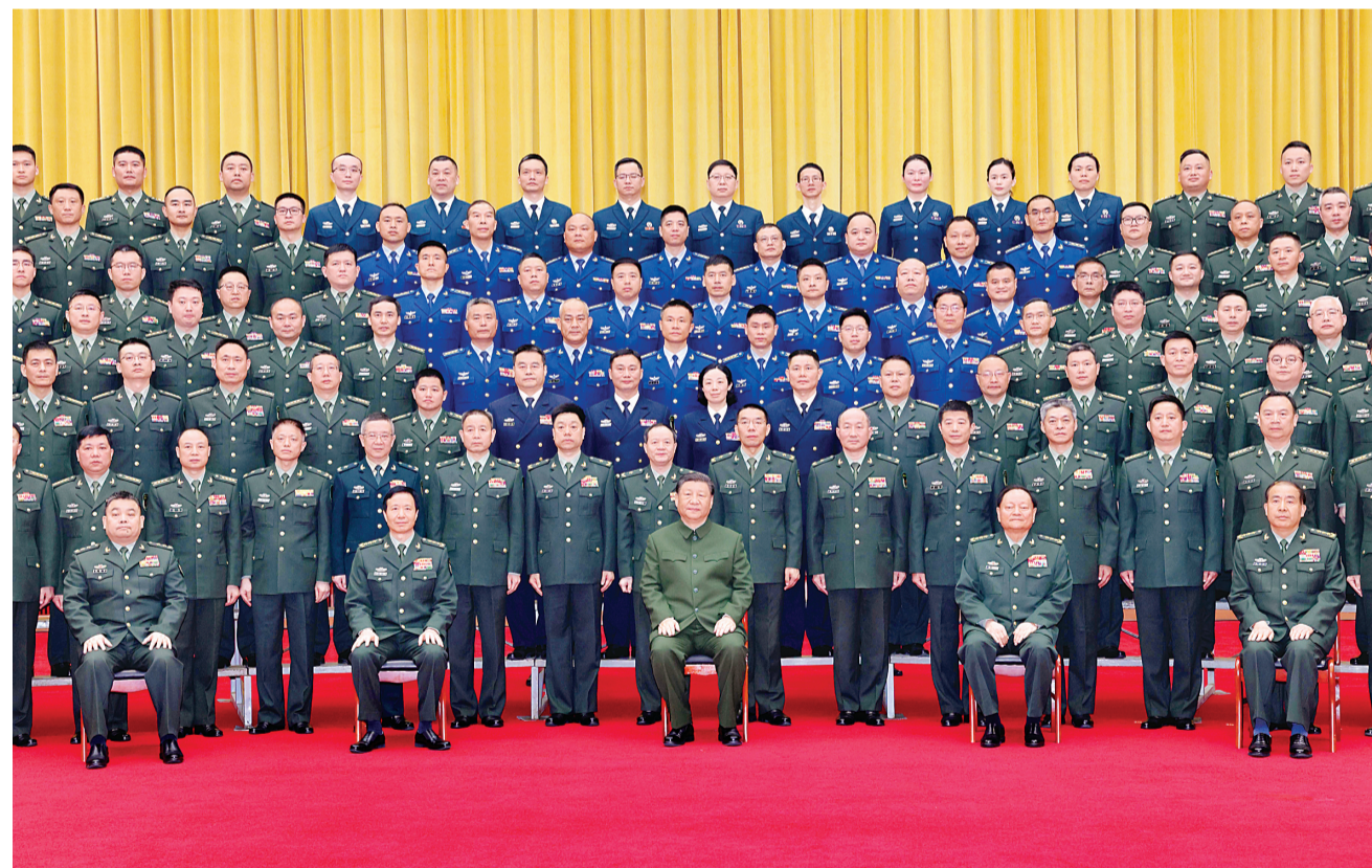
20日上午,习近平在长沙亲切接见驻长沙部队上校以上领导干部,代表党中央和中央军委向驻长沙部队全体官兵致以诚挚问候。

离开时,村民们纷纷围拢过来欢送总书记。习近平满怀深情地对大家说,党中央高度重视“三农”工作,一定会采取切实有力的政策举措,回应老百姓的关切和需求,把乡村振兴的美好蓝图变为现实。掌声在村庄久久回荡。(下转第2版)