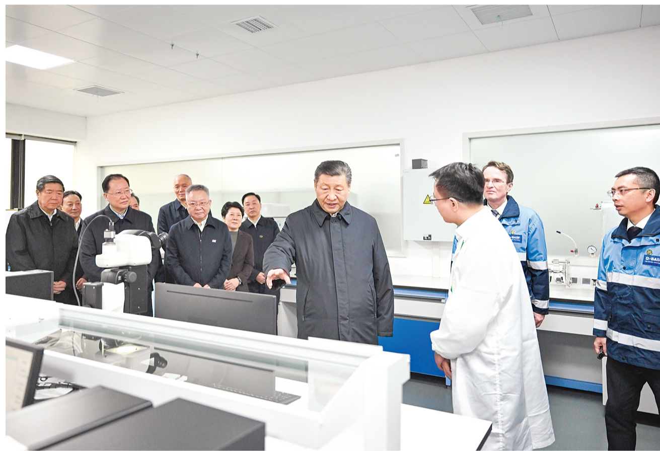
18日下午,习近平在中德合资企业巴斯夫杉杉电池材料有限公司考察。