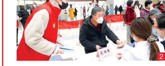
2 驻津央企中铁十八局集团五公司联合天津市第五中心医院等单位组织义诊活动。