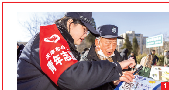
1 南开区禁毒办联合王顶堤街公共安全办等单位在王顶堤街道溱园开展“学雷锋”文明实践系列宣传活动。

据市委社会工作部相关负责人介绍,未来将履行好负责全市志愿服务的工作职责,集聚更多社会力量,加强京津冀志愿服务协同发展,指导推动全市广泛开展各类志愿服务活动,让志愿服务更好融入基层社会治理,助力提升城市治理现代化水平。