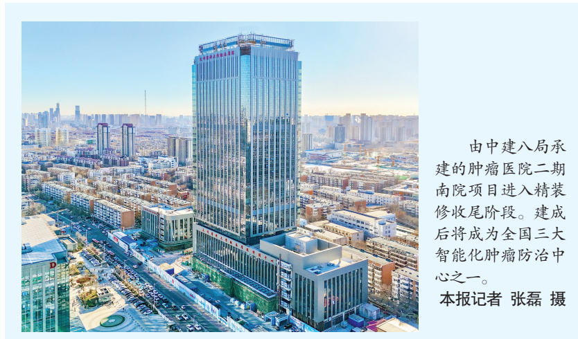
由中建八局建设的肿瘤医院二期南院项目进入精装修收尾阶段。建成后将成为全国三大智能化肿瘤防治中心之一。

“希望在不久的将来,具有‘全面康复’理念的复合型、创新型康复人才越来越多,患者的生活质量也会越来越高。”艾汀说。