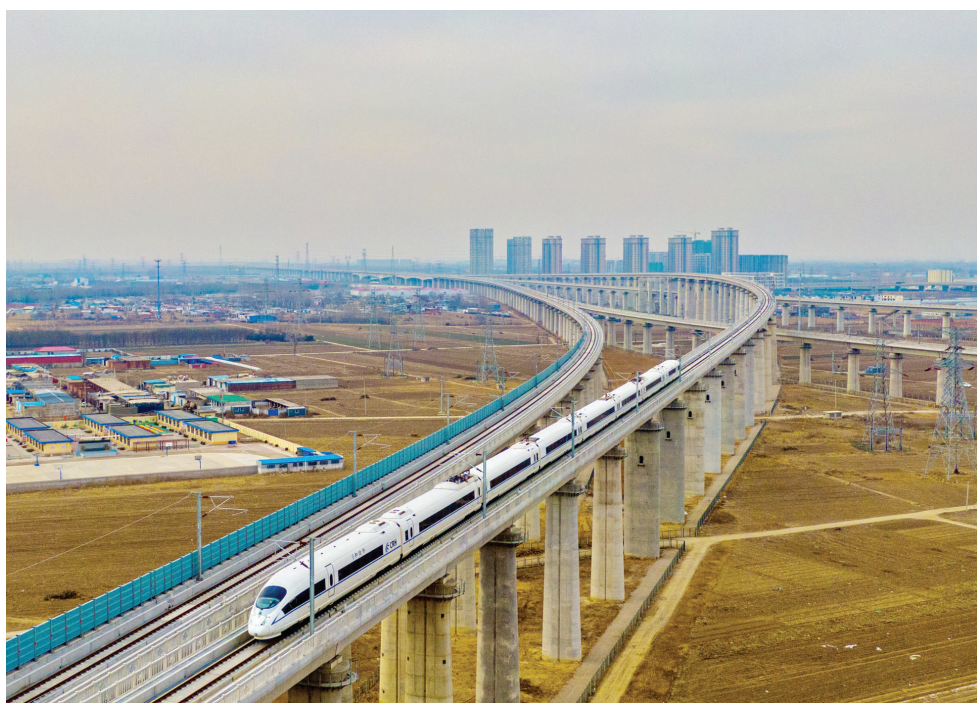
2022年12月30日,京唐城际铁路开通运营。图为动车组列车驶过京唐城际铁路唐山特大桥。(资料片)