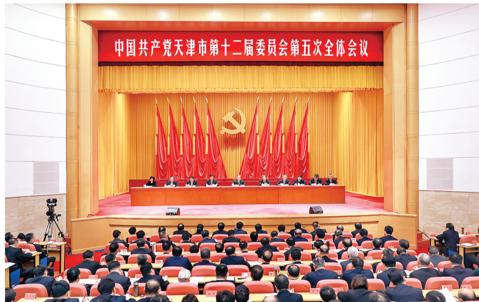
中共天津市委十二届五次全会会议现场。

全会强调,要把深入学习贯彻习近平总书记视察天津重要讲话精神作为当前和今后一个时期的首要政治任务。深刻认识习近平总书记视察天津是我市发展进程中具有标志性意义的里程碑,习近平总书记视察天津重要讲话精神是做好新征程上天津工作的指南针,能否做到深学深用、善作善成是检验政治判断力、政治领悟力、政治执行力的试金石。深刻领悟“两个确立”的决定性意义,坚决做到“两个维护”,一切工作必须听从习近平总书记指挥,服从党中央决策,一切工作必须从全局谋划一域、以一域服务全局,一切工作必须落地落实、见行见效,一切工作必须以人民为中心、以安全为底线,学在深处、谋在新处、干在实处,切实把习近平总书记的关怀厚爱转化为强大精神动力、工作动力、发展动力,把习近平总书记的殷殷嘱托全面落实到津沽大地上。