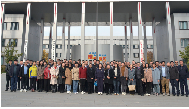
▲市政府办公厅组织青年党员干部到雄安新区调研学习

调查研究是谋事之基、成事之道，是苦练“善作善成”内功的“先手棋”和有效载体。当前，奋进新征程的天津正呈现新的活力和生机，同时推进高质量发展仍面临不少风险挑战，迫切需要全市党员干部善于运用党的创新理论研究新情况、解决新问题、总结新经验、探索新规律，关键要用好调查研究这个法宝。市政府办公厅深入落实大兴调查研究这个政治要求，健全长效机制，坚持从新形势新任务中体悟谋划，把对党、对领袖绝对忠诚体现在谋划推动各项重点工作上。围绕贯彻落实习近平总书记视察天津重要讲话精神，组织党员干部结合岗位职责，厘清思路、明确路径、找准抓手，更加主动谋划好当前各项工作，服务市领导把“四个善作善成”的重要要求切实转化为一条条政策措施、一个个工作抓手、一项项具体行动，推进见行