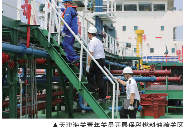
▲天津海关青年关员开展保税燃料油跨区直供承运船舶调研工作

助推高质量发展，促进高水平开放。习近平总书记指出，“我们将加快构建新发展格局，不断扩大高水平对外开放，持续放宽市场准入，让开放的大门越开越大”。天津海关青年扎实开展行“海关工作必须坚持把与地方发展同频、与企业需求共振”，促进高水平开放海关必作“要求，积极助力天津“在进一步全面深化改革开放上善作善成”。一是提高服务开放发展水平。提高“船边直提”“抵港直装”应用规模，联合天津港集团持续丰富富集港集疏港智慧平台功能，扩大“内外贸货物同船运输”改革试点，提高天津口岸过货能力和通行效能。加快推进天津市临港综合保税区和验收运作，推动“港关产城”深度融合。二是推动外贸稳量提质。面向市重点项目开展全周期服务，依托天津自贸试验区综合保税区探索首单便利化制度创新。立足天津实际创新跨境电商发展新路径新模式，扩大跨境电商直邮进